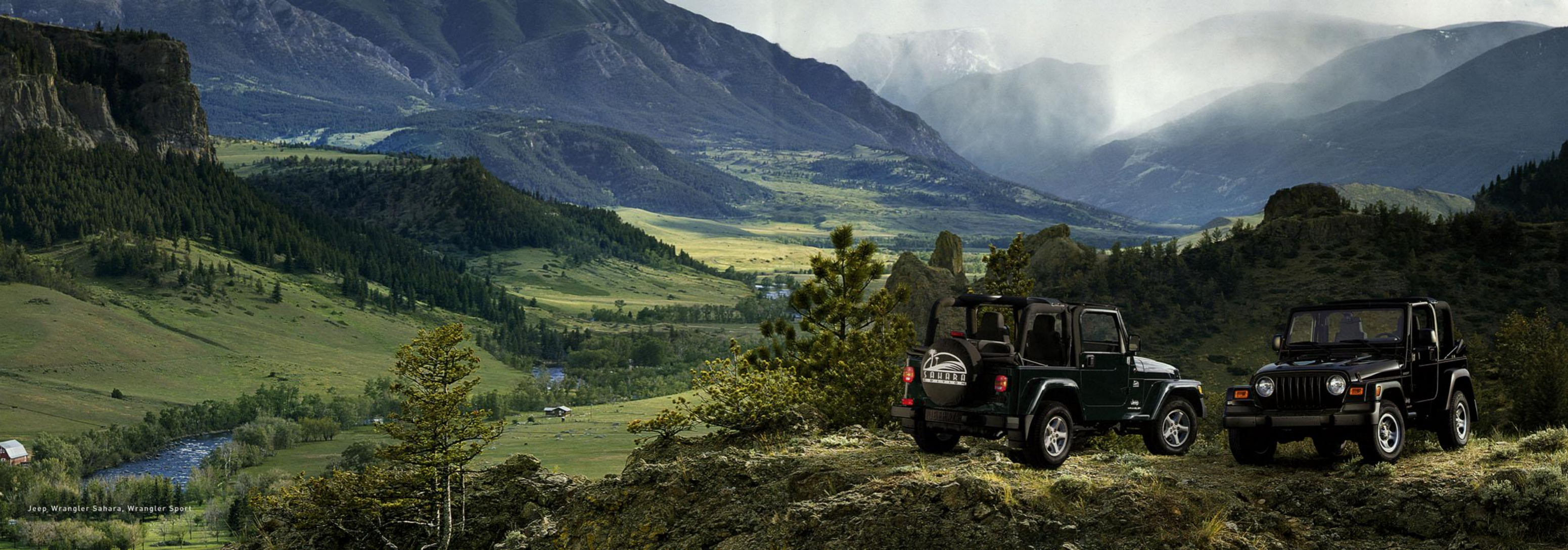
Jeep Wrangler Sahara, Wrangler Sport