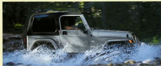
Das oben abgebildete Modell Wrangler Sahara in Bright Silver Metallic beeindruckt mit einem individuellen Ausstattungspaket. Rechts: Jeep, Wrangler Sport in Midnight Blue Metallic mit optionalem Original Jeep, Zubehör.

Der Jeep, Wrangler ist in zwei Ausstattungsvarianten erhältlich. Zum einen als Wrangler Sahara mit besonderem Komfort und ausdrucksstarkem Design. Zum anderen als Wrangler Sport mit legendären Geländefähigkeiten und individueller Optik. Beide Modelle können wahlweise mit 4.0 l-Reihensechszylinder und mit 2.4 l-Reihenvierzylinder ausgestattet werden. Konzipiert und gebaut wurde der Jeep, Wrangler mit Blick auf Leistung und optimales Offroad-Verhalten – allerdings macht er auch auf der Straße ein gute Figur.