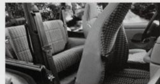
Wranglers patenterte «tip-and-slide» forseter gir enkel inn- og utstigning.

Når det gjelder terrengkjøring kan det virke malplassert å snakke om sittekomfort. Men etter 10 timer i terrenget, eller på motorveien for den saks skyld, er det ikke fritt for at sittekomfort betyr noe likevel. Legg merke til de solide sidestøttene på forsetene. De holder deg på plass, når Wrangler bykser frem i ulendt terreng. Baksetet er høyt, bredt og behagelig, og det er lett tilgjengelig takket være forsetenes vippe-funksjon. Innvendig er det plass til alt og alle. I det romslige baksetet sitter to voksne bekvemt, og bak er det plass til 320 liter med bagasje. Skal du laste inn mer, må du si farvel til baksetepassasjerene og folde setet sammen. Da har du hele 1045 liter til rådighet. Trenger du enda mer plass? Fjern baksetet, så har du imponerende 1563 liter til disposisjon! En annen godbit er Wranglers nye klimakontroll-system. Gjennom de overdimensjonerte ventilene på dashbordet sendes store luftmengder inn i kupeen og varmer den opp på et blunk.